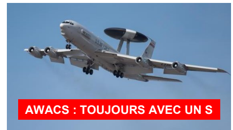
AWACS : TOUJOURS AVEC UN S

Voir les gagnants de classe après la deuxième partie.